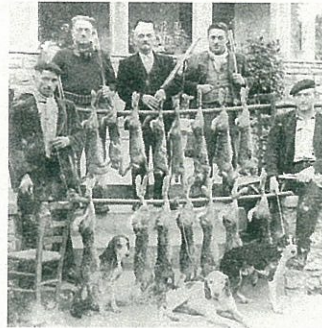
Cacciatori di lepri di Gombio di Polaveno (nel 1952)