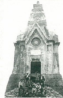
Monumento al Redentore sulla cima del Golem