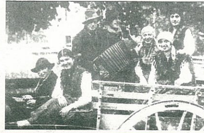
Costumi Valtrumplini nei giorni di festa