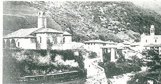
Il Tram arriva a Tavernole, capolinea della linea tranviaria valtrumplina fino agli anni cinquanta quando i binari vengono smantellati.